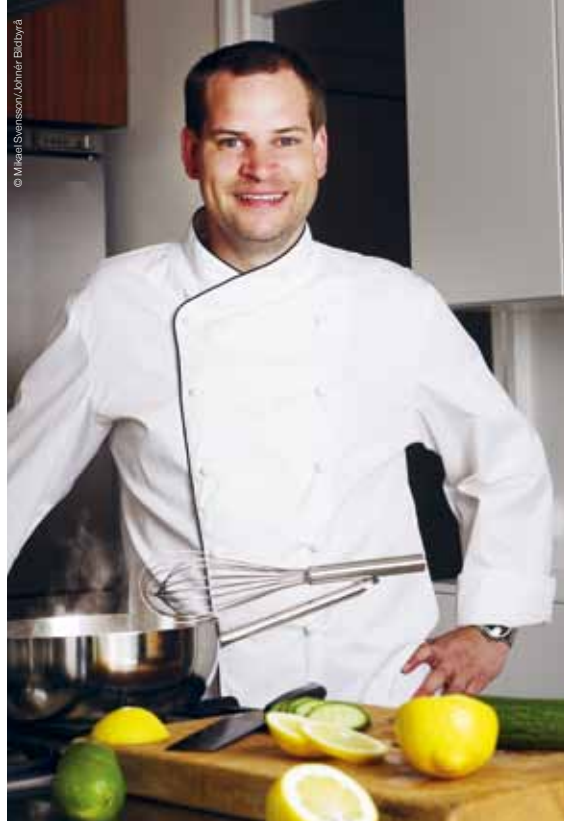
Ett sätt att leva klimatsmart är att äta lokalt producerat och mer vegetariskt.

Utsläppen av växthusgaser från den privata konsumtionen beror på hur vi äter, reser, bor och shoppar. Källa: Konsumtionens klimatpåverkan. Naturvårdsverket 2008.